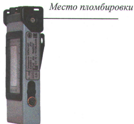
Рисунок 2 - Схема пломбировки от несанкционированного доступа