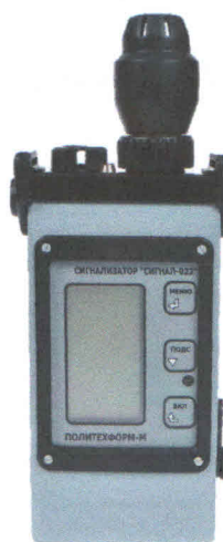
Рисунок 1 - Общий вид сигнализатора "СИГНАЛ-022" с внешним датчиком

Схема пломбировки от несанкционированного доступа, обозначения места нанесения знака поверки представлены на рисунке 2.