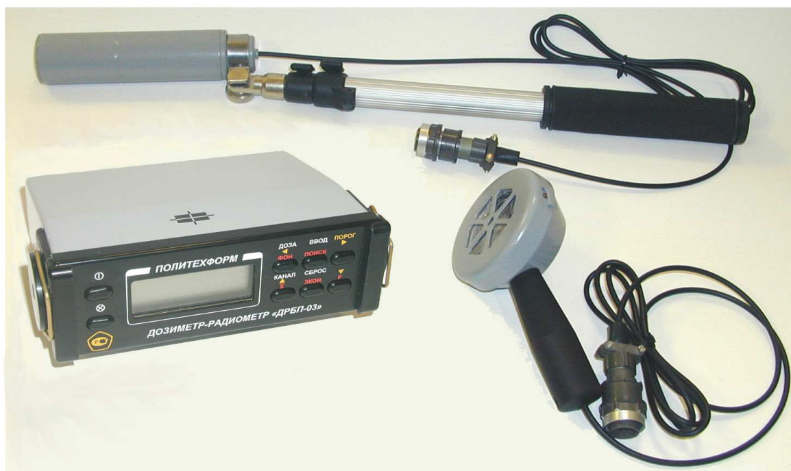
Рисунок 1 - Внешний вид дозиметра с блоками детектирования и штангой

Дозиметр комплектуется удлинительной штангой и блоком зарядки аккумулятора. Внешний вид дозиметра и места пломбировки приведены на рисунках 1 и 2.