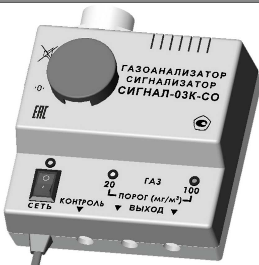
Рис. 1. Общий вид сигнализатора «Сигнал-03К-СО»